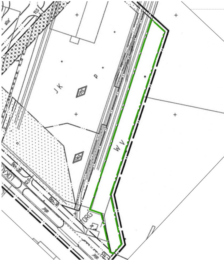
Utdrag från del av detaljplan för Västra Lundbyhamnen inom stadsdelen Lundbyvassen i Göteborg, akt II-4581

Planområdet omfattar del av fastigheten Lundbyvassen 736:155 som ägs av Göteborgs kommun. Områdets totala areal är cirka 3667 m 2 .